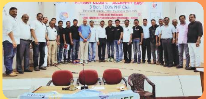
FLOOD RELIEF SUPPORT TO KERALA