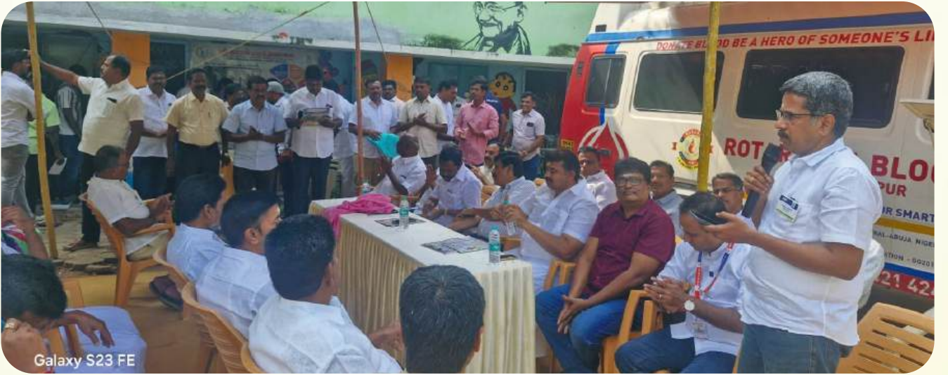
Galaxy S23 FE

மேலும், The Eye Foundation மூலம் கண் பரிசோதனை முகாமும், ஸ்ரீ குமரன் மருத்துவமனை மூலம் பொது மருத்துவ பரிசோதனையும் ஒரே இடத்தில் சிறப்பாக நடத்தப்பட்டது. இதன் மூலம் பொதுமக்கள் பலர் தங்களது உடல்நலத்தைப் பரிசோதித்து ஆலோசனைகள் பெற்றனர்.