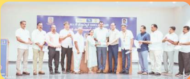
ARIVIN AADAI PROJECT CONTRIBUTION

SUPPORT TO STUDENTS EDUCATION AND SPORTS