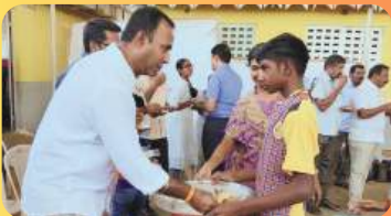
FOOD TO SPECIALLY ABLED CHILDREN