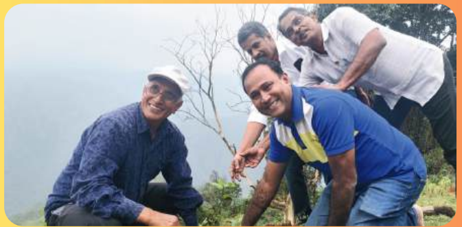
TREE PLANTATION AT KUNDAH