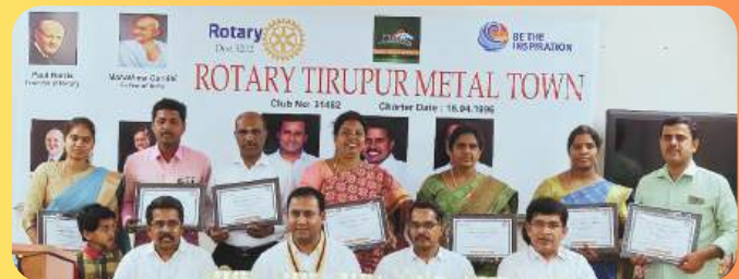
NATION BUILDER AWARDS TO GOVT SCHOOL TEACHERS