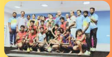
PRIZE TO VOLLEY BALL WINNERS