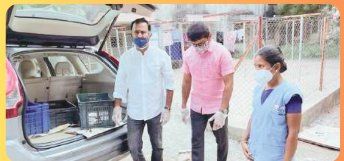
FOOD SUPPLIED DURING COVID LOCKDOWN TO DOCTORS AND HEALTH CARE WORKERS