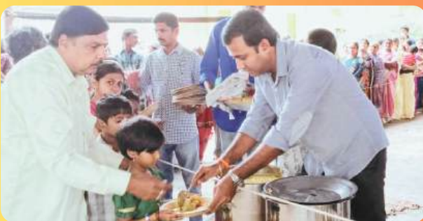
FOOD SPONSORED AT A TEMPLE FESTIVAL