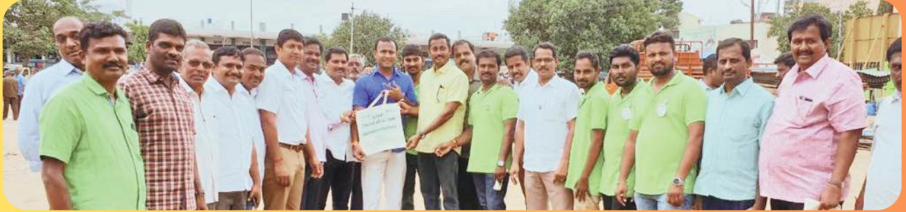
CLOTH BAGS USAGE AWARENESS TO PUBLIC