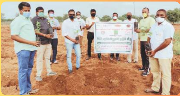
700 TREES PLANTATION