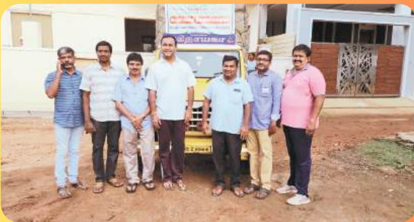
FLOOD RELIEF SUPPORT TO GUDALUR